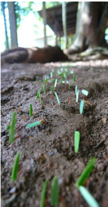
Mindestens so fleißig wie die Blattschneidameisen in unserer Schule waren wir

Der Juni neigt sich seinem Ende zu und ich bin schon dabei den nächsten Erfahrungsbericht zu schreiben. Ich bin mir noch nicht ganz sicher, ob ich dieses Mal auf die normale Länge meiner Erfahrungsberichte komme, denn der Juni war vor allem geprägt durch viel Stress in der Schule. Aber lest selbst und überzeugt euch von meinem arbeitsreichen Leben hier: