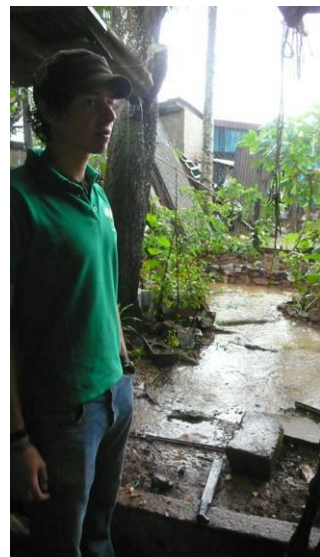
Garten unter Wasser, nicht nur einmal am Tag

dem Abschied. Auch wenn ich weiss, dass er nicht für immer sein muss, kann und will ich niemandem versprechen, dass ich wieder kommen werde. Und bei all diesen belastenden Gedanken bleiben mir ja eigentlich noch gut 9 Wochen, in denen ich noch so viel erleben und erreichen kann. Sieben Wochen Schularbeit in der ich noch gut voran kommen möchte. Wenigstens kann ich mich jetzt voll auf Nicaragua