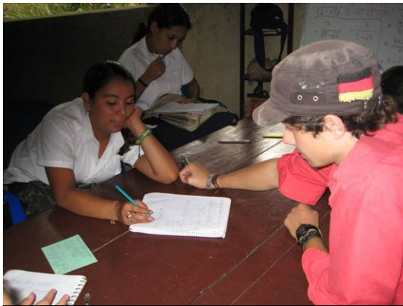
Beim Arbeiten mit „meiner“ Klasse, dem dritten ano.

durchbringen, sodass für meine Nachfolger nur noch Wiederholungen anstehen