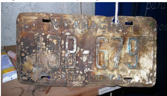
Nummernschild: 138-679, Nicaragua, sehr wahrscheinlich noch nicht abgemeldet... :)