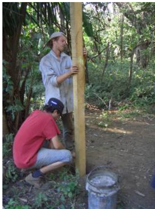
Bild: eine der tragenden Stelzen bekommt ihr Fundament

gut wie fertig zu sein, einzig dass Dach konnten wir nicht mehr zusammen auf den Pavillon setzen. Der Grund: es fehlte ein genügend starker Bohrer. Zwar hätten wir den bei einem Deutschen, der auch in Masaya lebt, ausleihen können. Doch er hat die Maschine nach guter nicaraguanischer Manier mehrfach vergessen. So mussten wir leider unverrichteter Dinge von dannen ziehen. Ein Bild des letztendlich fertigen Pavillon wird aber auf alle Fälle nachgereicht. Ich habe die Zeit in Masaya ,ehrlich gesagt ,sehr genossen. Es tat mir gut, wo anders zu sein, mit anderen Leuten zusammen zu leben. Ich habe diese Abwechslung einfach noch mal gebraucht, kurz bevor die Schule wieder losgeht.