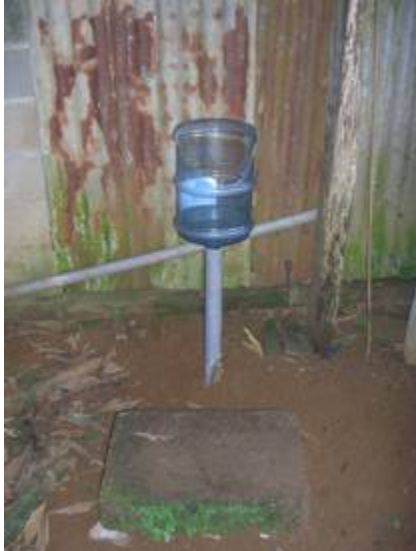
Bild: unser eigenes Pissoir

zurückgeblieben sind. So haben wir weniger Altmaterial zu lagern und ich habe meinen Tisch. Alle sind ein wenig glücklicher! :D