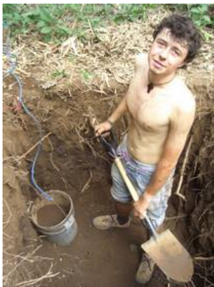
Bild: Freiwilliger als Erdmännchen

Ich möchte euch hier nicht zu viel erzählen, aus dem einfachen Grund, dass es hier kaum etwas wirklich Wichtiges zu erzählen gibt. Während der Tage in Masaya haben wir gemeinsam mit den Masayanern ein paar bisher unerledigte Arbeiten in Angriff genommen. Das war einmal der Neubau des von Termiten zerfressenen alten Unterrichtspavillons, sowie die Neuanlage einer Latrine für die Masayaner. Die letzten 20 Jahre und etliche Freiwilligenjahrgänge haben die alte Latrine bedenklich voll werden lassen. Neue Latrinen sollten mindestens eine Tiefe von 8 bis 10 Metern haben. Das war also mehr als genug Arbeit für knapp eine Woche.