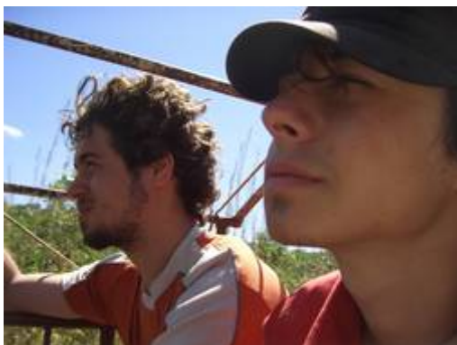
Bild: das Gefühl der Freiheit beim Trampen

Ich will euch einen Einblick in unsere Trampreise gewähren. Aus Nueva Guinea herauszukommen stellt immer die erste Hürde dar. Da steht und läuft man schon mal bis zu einer Stunde, bis nicht mehr nur Taxis hupend an einem vorbeirauschen. Die Stadt hat man längst hinter sich gelassen. Was nun beginnt, ist die Finkazone. Von allen Seiten münden Finkawege auf die Carretera (=Autobahn, besser Schnellstraße(dt.)). Ab hier findet man nur noch die großen und kleinen Camions (=Laster (dt.)), zumeist alte IFAs, die Vieh,