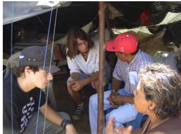
Bild: Im Interview

Wir waren zu dritt dort. Zum einen, um eine Unterstützung in Form von etwa 20 Kilo Bohnen abzugeben und um über das Camp zu berichten. Ich habe vor, eine Art Podcast zu erstellen, mit vielen Originalstimmen und Stimmungen aus dem Camp. Leider weiß ich nicht, ob ich in den nächsten Wochen Zeit dafür finden werde. Sobald es soweit ist, werde ich euch natürlich darüber informieren, wo ihr euch den ersten Audio-Eindruck aus