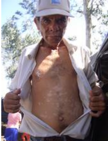
Bild: Nemagon Geschädigter

Bananenriesen Dole (gehört zu Standart Fruit Company), Chiquita (ehemals United Fruit Company) und Del Monte verseucht wurden.