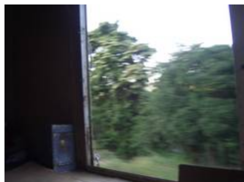
Bild: Blick auf die nicaraguanische Landschaft