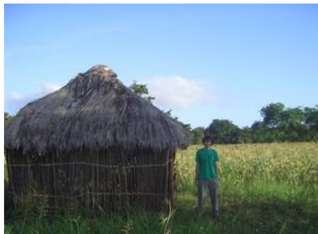
Bild: Unsere Bleihe in Nandaime