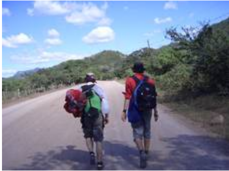
Bild: Irgendwo im Nirgendwo

Für die Weiterreise nach Jinotega haben wir uns für eine Carretera (ähnlich der dt. Schnellstraße, aber wie gesagt nur ähnlich) entschieden, die durch die verlassenen Berglandschaften hinter Estelí führt. Die Chance einen Ride zu bekommen, standen hier natürlich schlechter, aber es ging uns hauptsächlich um die Natur und die atemberaubenden Landschaften.