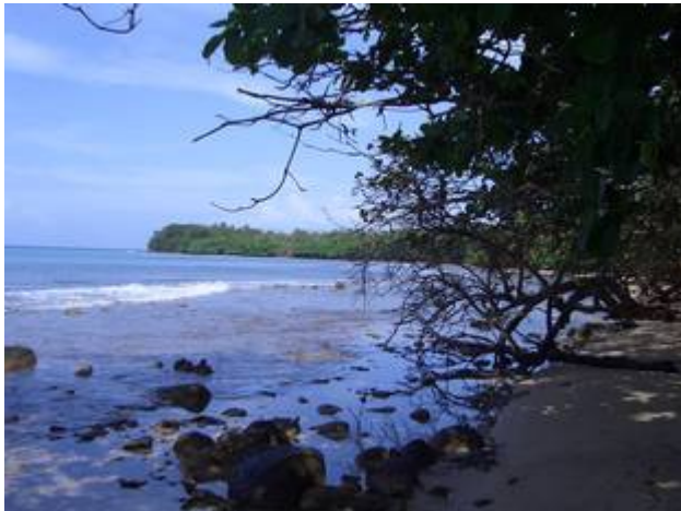
Bild: unsere ganz private Idylle auf Little Corn Island

Am 2.1.2008 setzten wir dann wieder auf die Hauptinsel, Big Corn Island, über und wollten am folgenden Tag mit dem Schiff wieder ans Festland übersetzen. Wegen schlechtem Wetter und Problemen mit der Schifffahrtsbehörde in Managua,