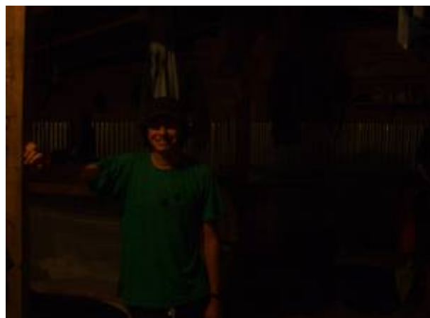
Bild: In der Bauerbeiterbaracke

Nach mehreren harten Stunden jedenfalls kamen wir endlich auf der anderen Seite an. Eine Straße führte in die nächste Bucht. Dort angekommen, wurden wir schon wieder enttäuscht. Wir waren auf eine der Baustellen für Luxusvillen gestoßen. Es war schon dunkel, ein weiterkommen war unwahrscheinlich, also haben wir uns erstmal in der Bucht niedergelassen. Ziemlich schnell kamen die Bauerbeiter