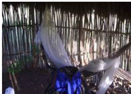
Bild: Hängematte in der Hütte