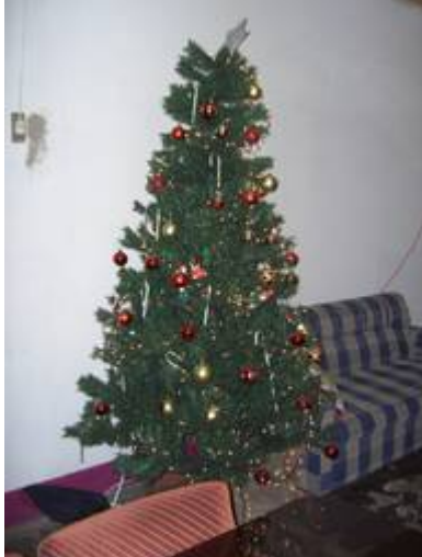
Bild: ein 1-A-Plastikbaum