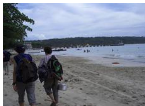
Bild: Strand vor Big Corn Island

Aber noch mal langsam, zu allererst kam die Überfahrt. Für läpische 150 Cordoba (entspricht etwas mehr als 5€) wurden wir von einem Schiff auf die Corn Islands gefahren, die circa 70km vor der Atlantikküste Nicaraguas liegen. Um es auf den Punkt zu bringen, die Fahrt war die Hölle. 5 Stunden Wellenberg rauf, Wellenberg runter, Wellenberg rauf, Wellenberg runter. Nicht