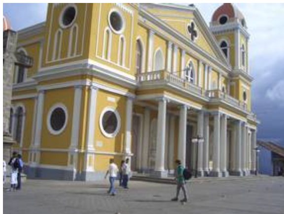
Bild: Kathedrale von Granada

Granada, eine der am besten erhaltenen Kolonialstädte Mittelamerikas. Die vielen Kolonialhäuser in ihren grellen Farben, die große Kathedrale und die vielen Kleinigkeiten, wie die zahlreichen Parks und Brunnen, geben dieser Stadt echten Charme. Mir hat es dort sehr gut gefallen, wäre da nicht der Fakt, dass Granada zur Hälfte von Ausländern besiedelt scheint. Es ist komisch, aber seit ich hier in Nicaragua bin, reagiere ich ein wenig