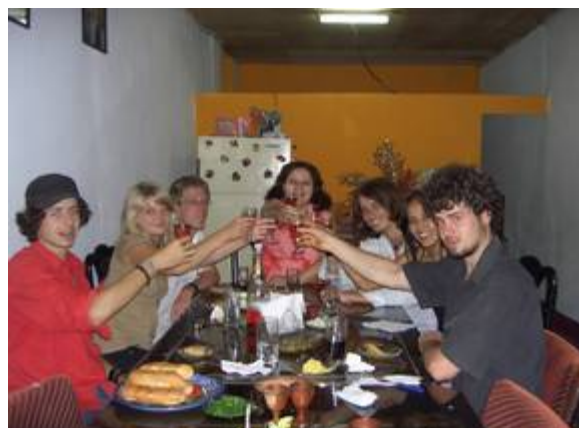
Bild: Weihnachten 2007 in Nicaragua

Weihnachten stand vor der Tür. Irgendwie eine komische Sache, wenn man sein erstes Weihnachten ohne Familie und Gutsle feiern darf/muss. Um alle Fragen wie, gibt's dort überhaupt Weihnachten und feiern die das, im Voraus zu beantworten. Ja, die Nicaraguaner sind sehr gläubige Menschen. Weihnachten ist ein sehr wichtiges Fest und es wird gefeiert. Allerdings feiert man grundsätzlich