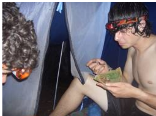
Bild: selbstgebackene Kekse, aus Kokosbrot, Kokosnussfleisch und Caña-Sirup, sehr lecker!

Dann kam Sylvester der nächste Feiertag außerhalb Deutschlands. Unser Sylvester dieses Jahr war auch komplett anders als sonst. Statt Kabarett im Fernsehen, gab es Sterne gucken. Statt Sekt zum Anstoßen hatten wir die einzige Venta der Insel, die Fresco (=Fruchtsäfte mit viel Zucker in kleinen Plastiktüten) verkauft, leer gekauft. Und zum