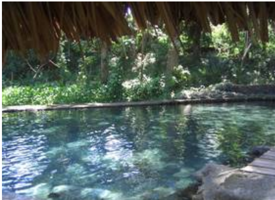
Bild: Ojo de Agua, Thermalbad auf Ometepe