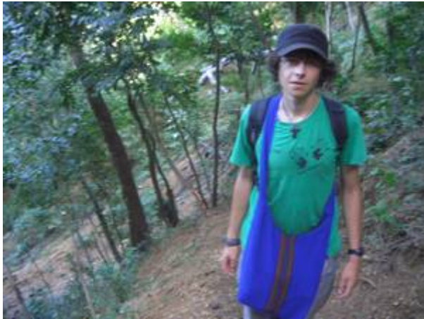
Bild: Auf der Flucht vor San Juan del Sur

Damit waren wir natürlich entdeckt und wurden von den Bauarbeitern fast mit Fragen überfallen. Wo kommt ihr her? Wo liegt Deutschland? Gibt es dort Schnee? Wo sind deine Eltern? In Deutschland spricht man auch Spanisch, oder? Wir waren die