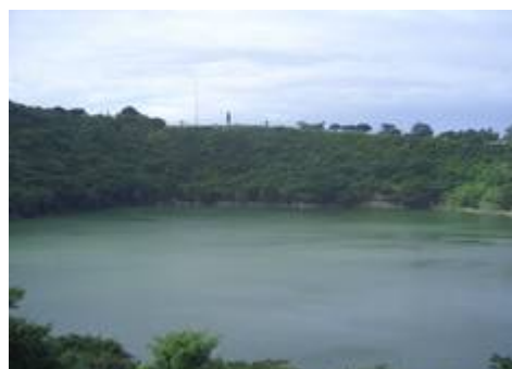
Bild: Laguna Tiscapa, Managua

Wer erwartet, Managua wäre eine echte „Stadt“, der wird enttäuscht. Viel mehr ist